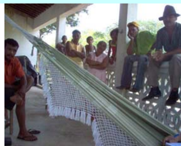
Reunião com técnicos e Associados Diagnóstico Rural Participativo – DRP