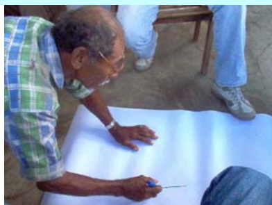
Mapa –Esboço do Mapa pelos assentados