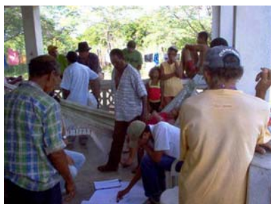
Reunião com técnicos e Associados – Diagnóstico Rural Participativo – DRP