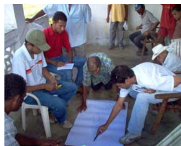
Reunião com técnicos e Associados Diagnóstico Rural Participativo – DRP