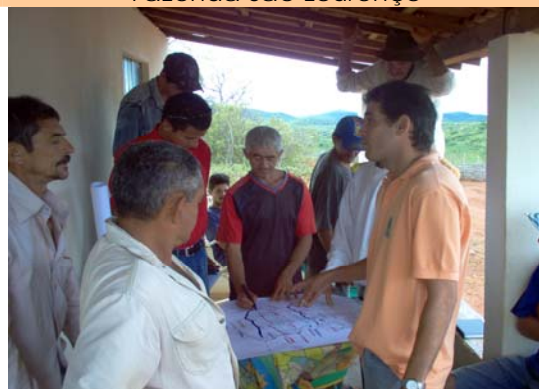
- Reunião - Esboço do Mapa da Propriedade