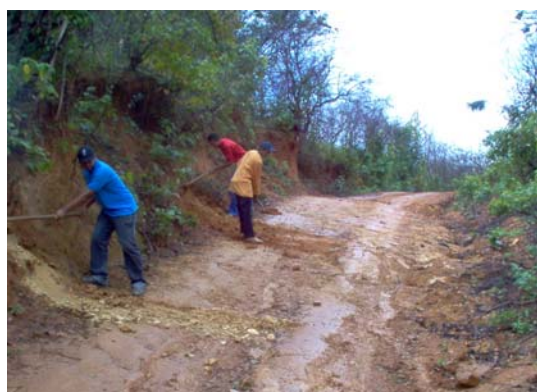
- Estradas sem manutenção- Estrada de acesso ao assentamento em condições precárias