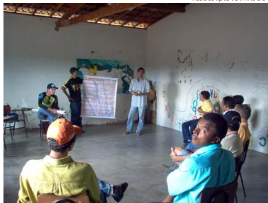
- Reunião - Técnicos da APNE e Assentados da Fazenda São Lourenço