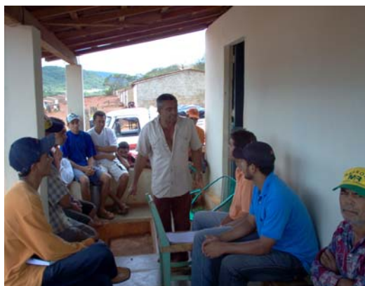
- Reunião - Técnicos da APNE e Associados na fazenda São Lourenço