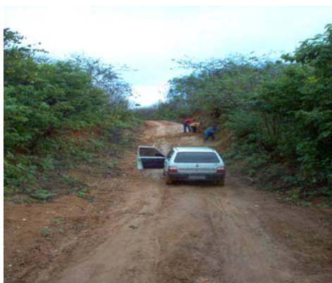
- Estrada de acesso- Estrada de acesso ao assentamento em condições precárias